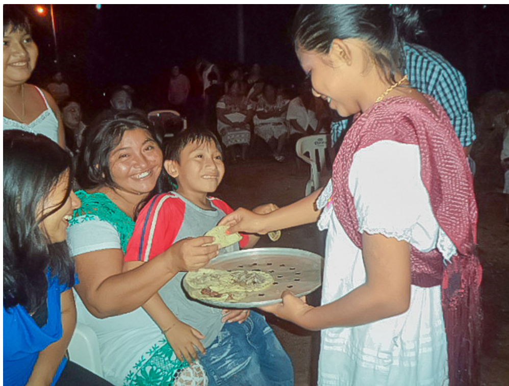
Lugar: Dzitnup, Yucatán. Año: 2013