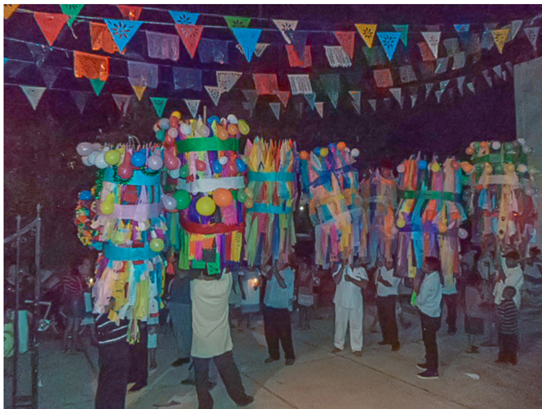
Lugar: Dzitnup, Yucatán. Año: 2013