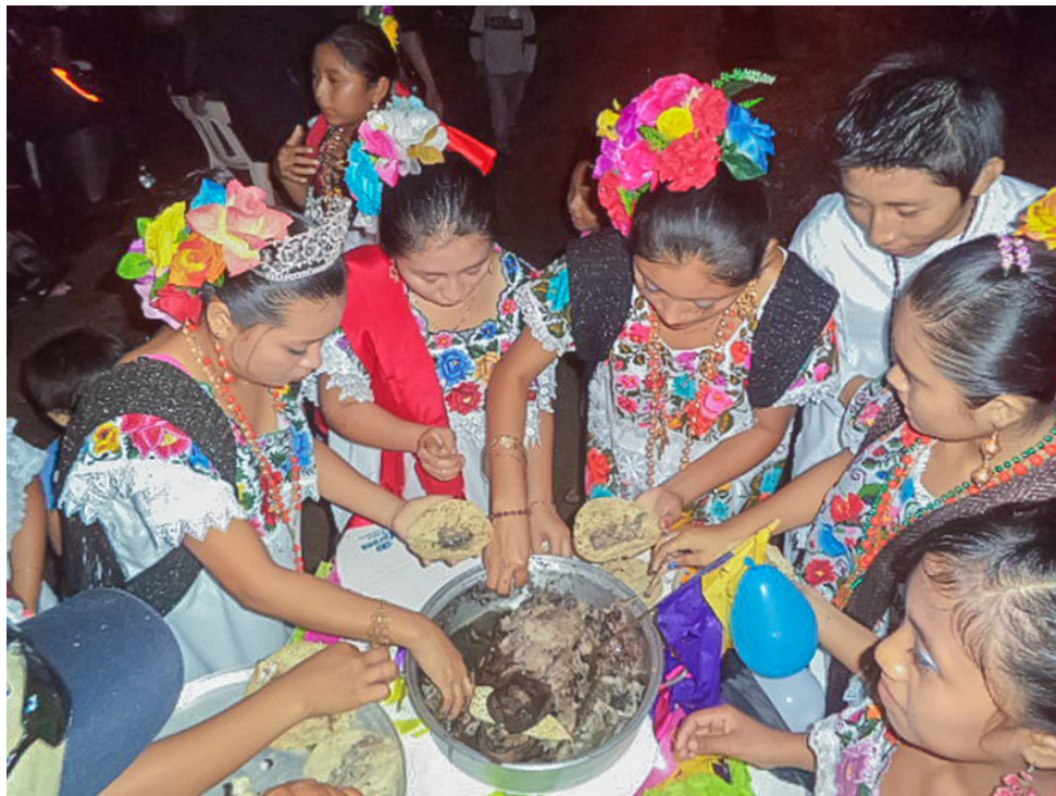
Lugar: Dzitnup, Yucatán. Año: 2013