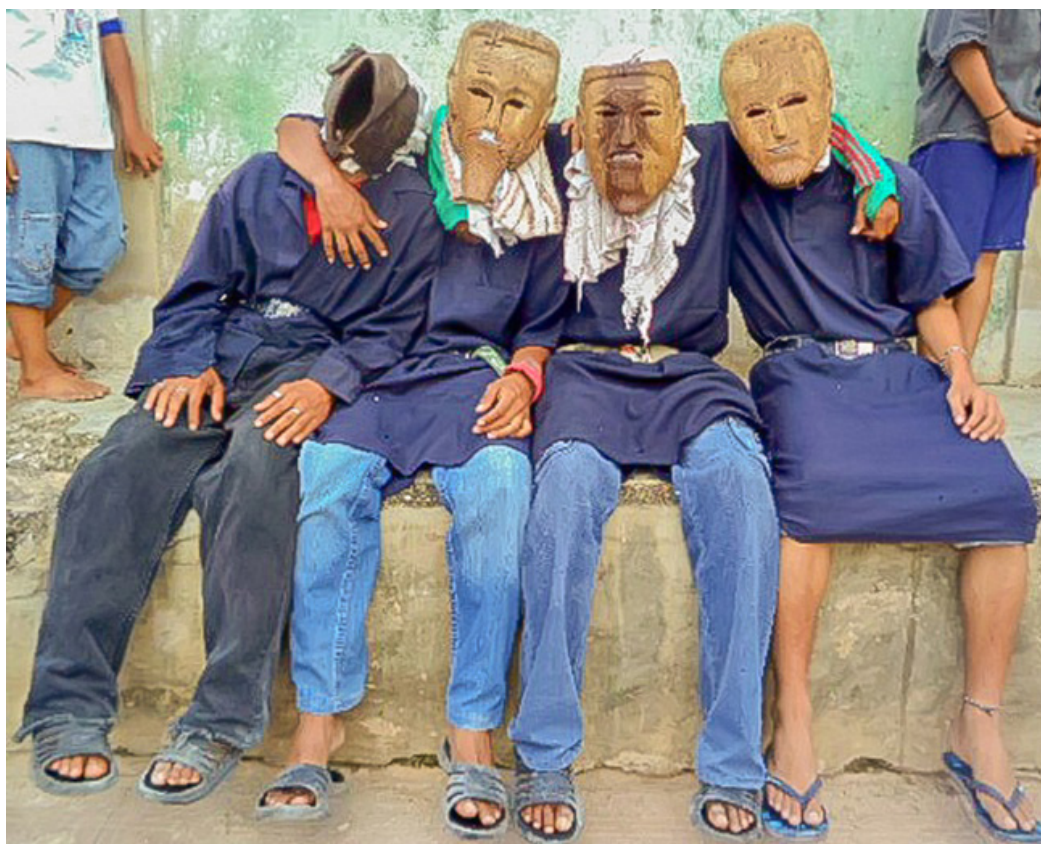
Lugar: Chikindzonot, Yucatán. Año: 2013