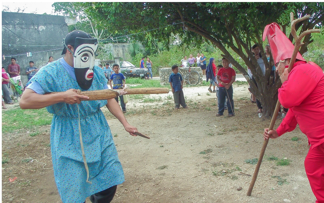
Lugar: Ebtún, Yucatán.