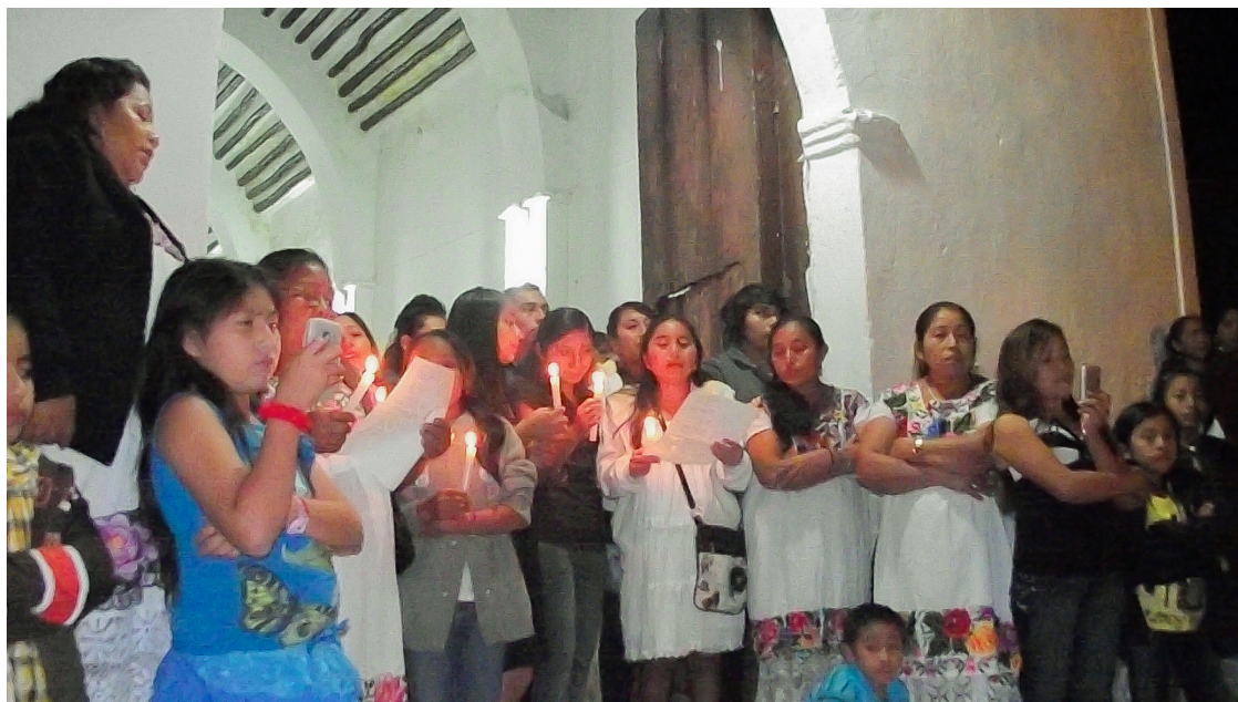
Lugar: Dzitnup, Yucatán. Año: 2012