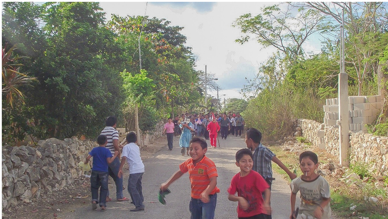
Lugar: Ebtún, Yucatán. Año: 2013