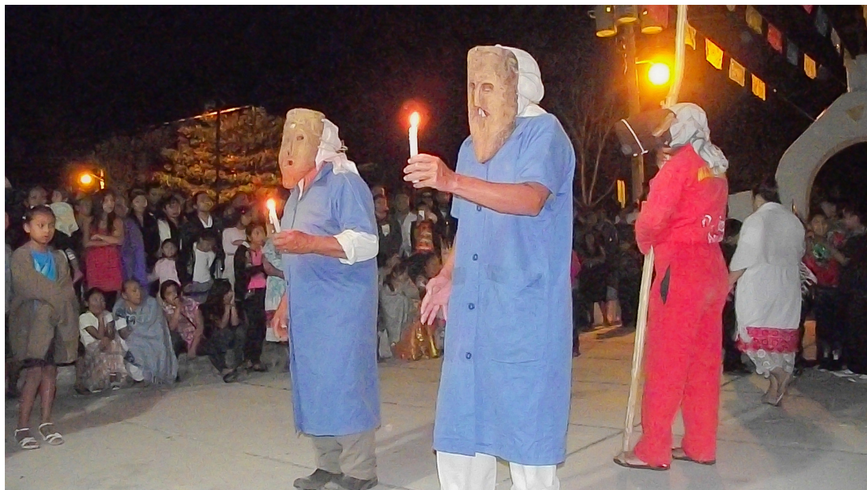
Lugar: Ebtún, Yucatán.