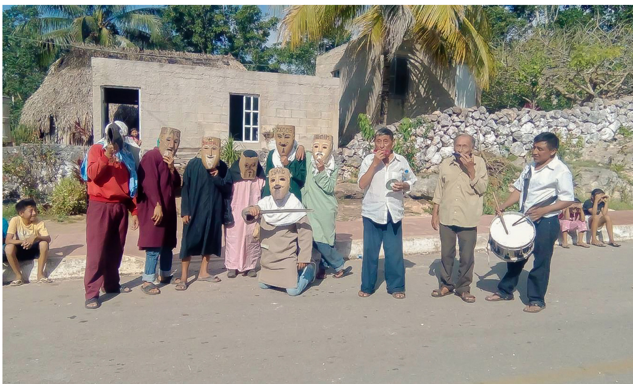
Lugar: Pop, Yucatán Año: 2015