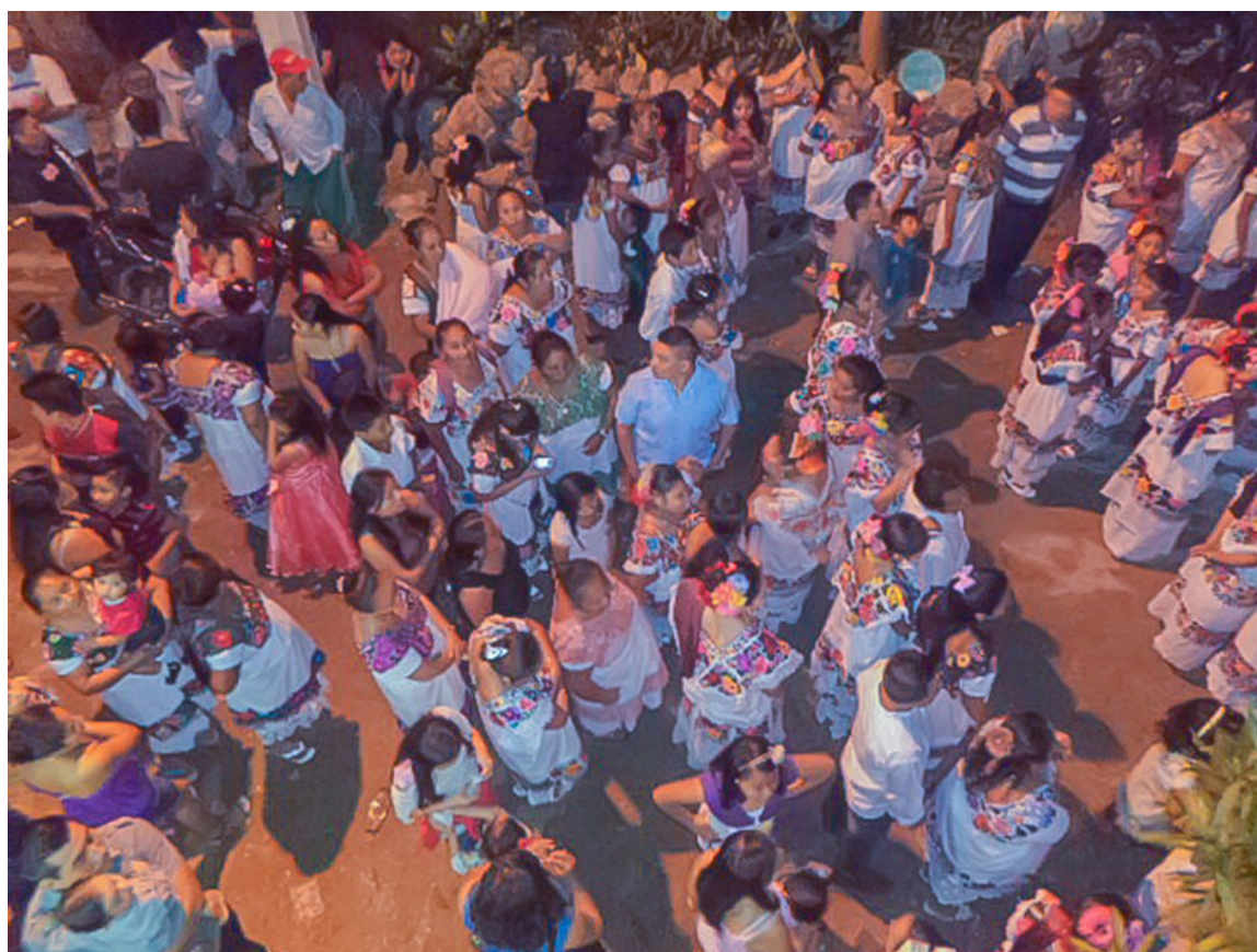
Lugar: Dzitnup, Yucatán. Año: 2013