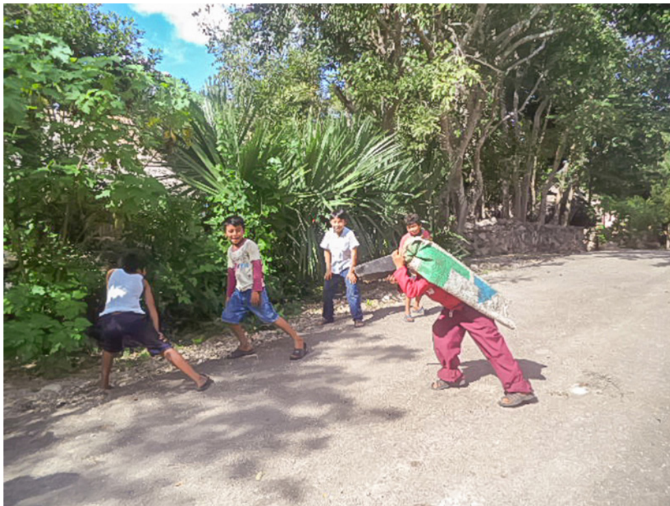
Lugar: Pop, Yucatán. Año: 2013