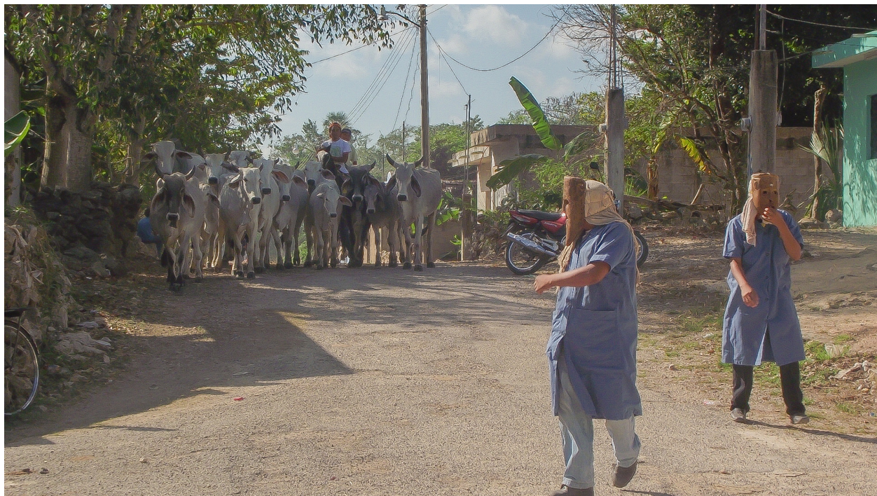
Lugar: Dzitnup, Yucatán. Año: 2013