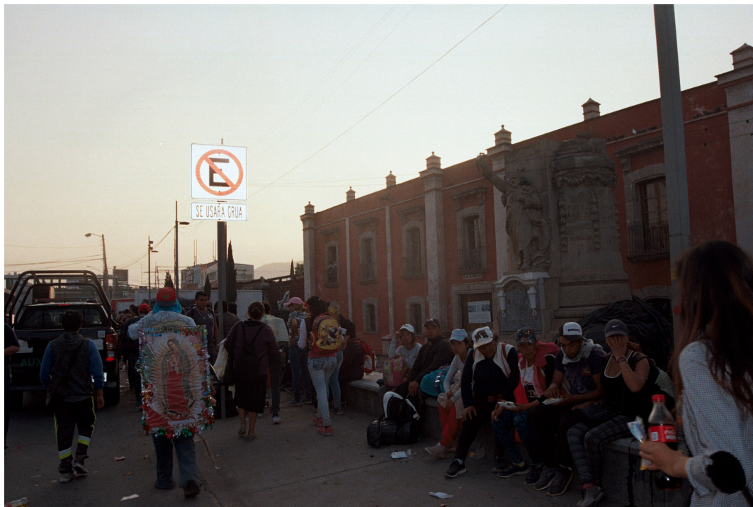
Imagen 10. Testigo centenario Fuente: Ismael Mejía Hernández, Ecatepec de Morelos, diciembre 2018