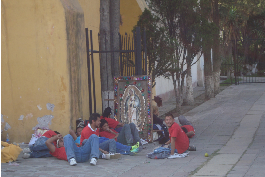
Imagen 9. Descanso Fuente: Ismael Mejía Hernández, Ecatepec de Morelos, diciembre 2011