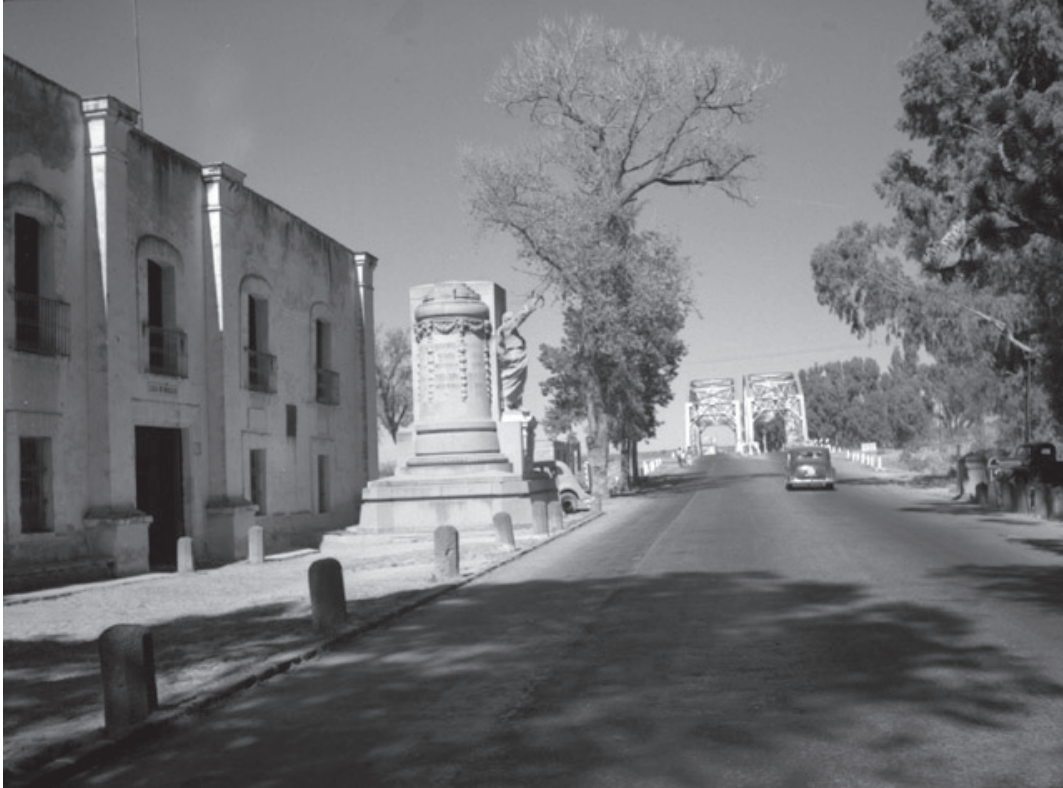
Imagen 7. Casa en que fue fusilado Morelos, fachada