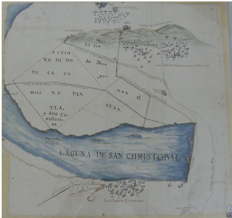
Mapa 2. San Cristóbal Ecatepec y Santo Tomás Chiconautla