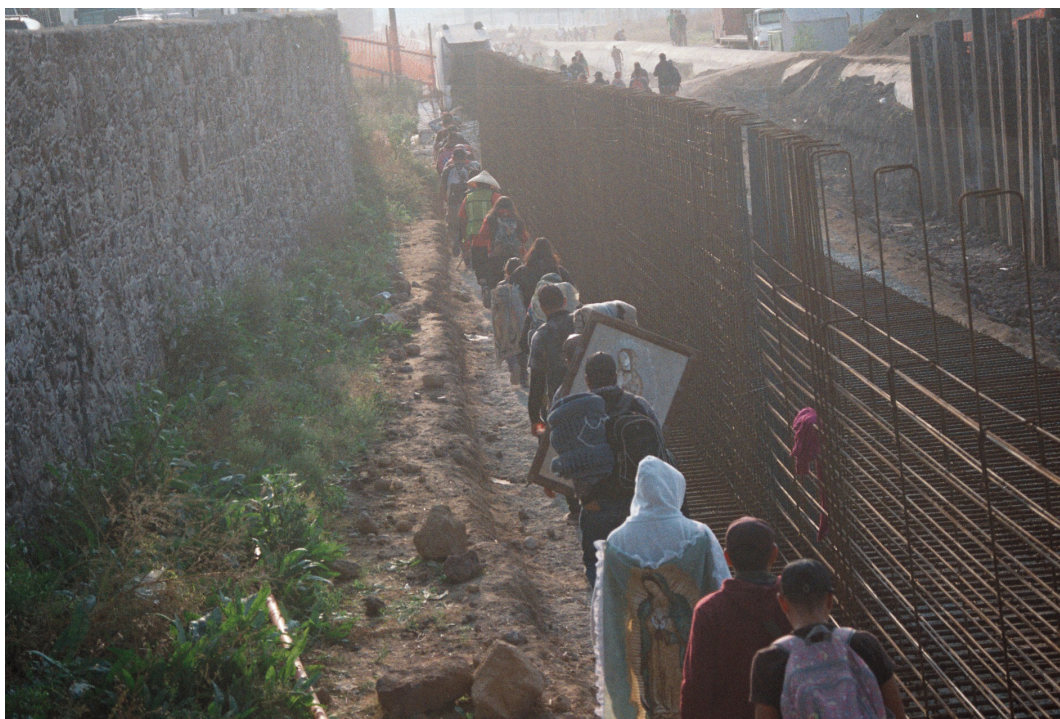
Imagen 4. Obstáculos de acero en el camino Fuente: Ismael Mejía Hernández, Ecatepec de Morelos, diciembre 2018