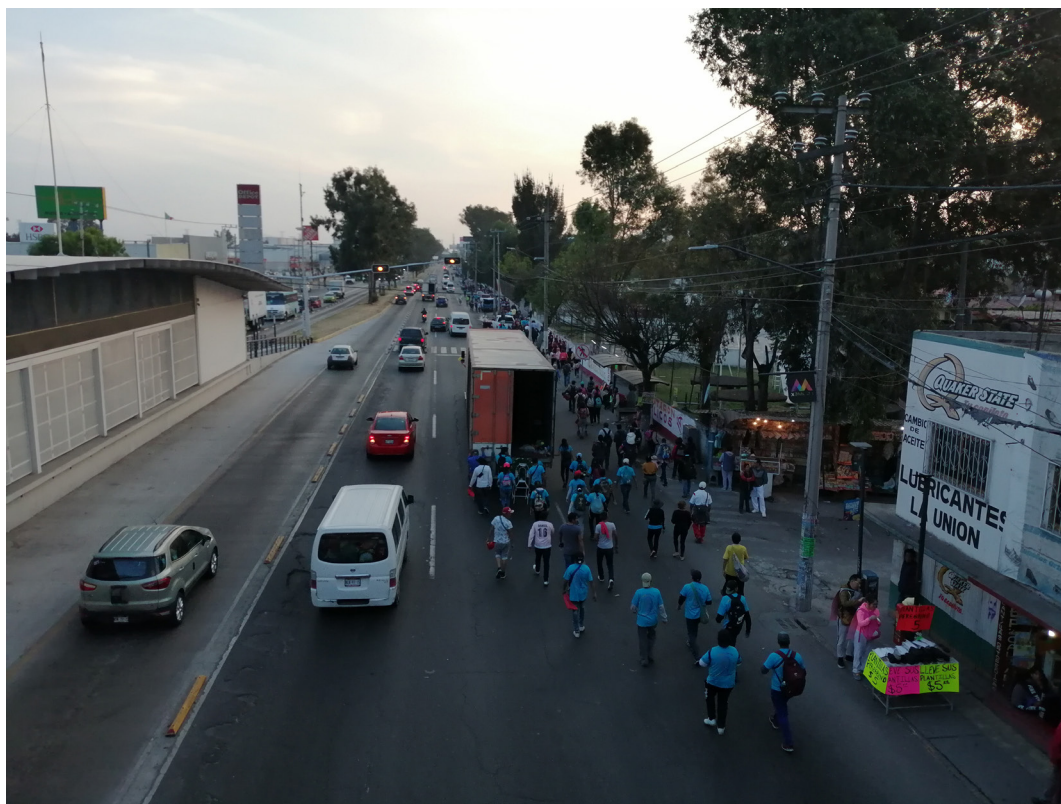
Imagen 14. Vía Morelos con estación Fuente: Miquizcohuatl Mejía Márquez, Ecatepec de Morelos, diciembre 2019