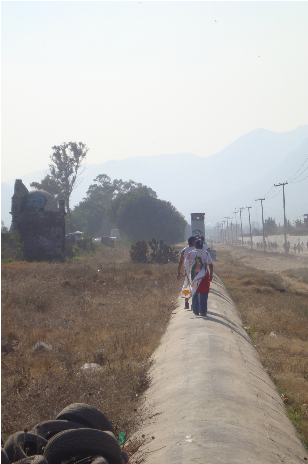
Imagen 2. Protegiendo las espaldas Fuente: Ismael Mejía Hernández, Ecatepec de Morelos, diciembre 2011