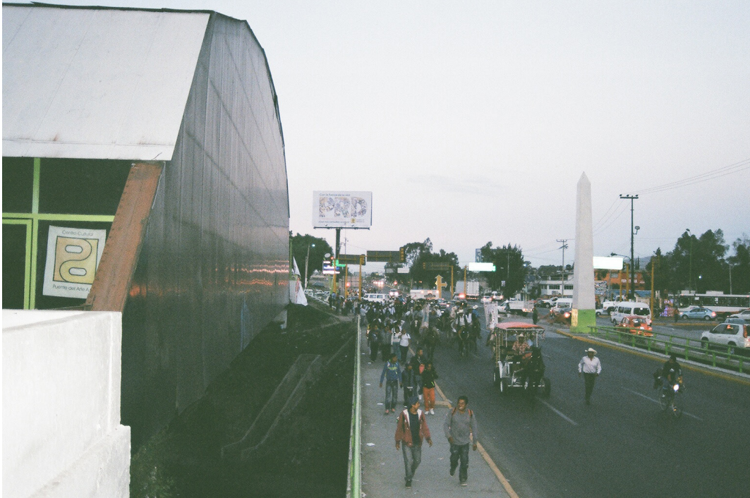
Imagen 11. Calandria, jinetes, peregrinos y puentes