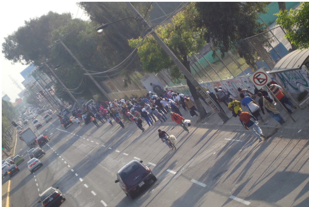
Imagen 13. Vía Morelos Fuente: Ismael Mejía Hernández, Ecatepec de Morelos, diciembre 2011