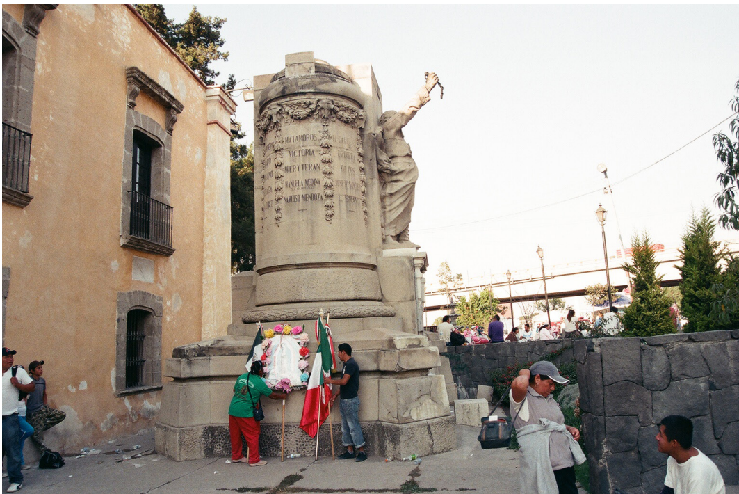
Imagen 8. Símbolos patrios Fuente: Ismael Mejía Hernández, Ecatepec de Morelos, diciembre 2009