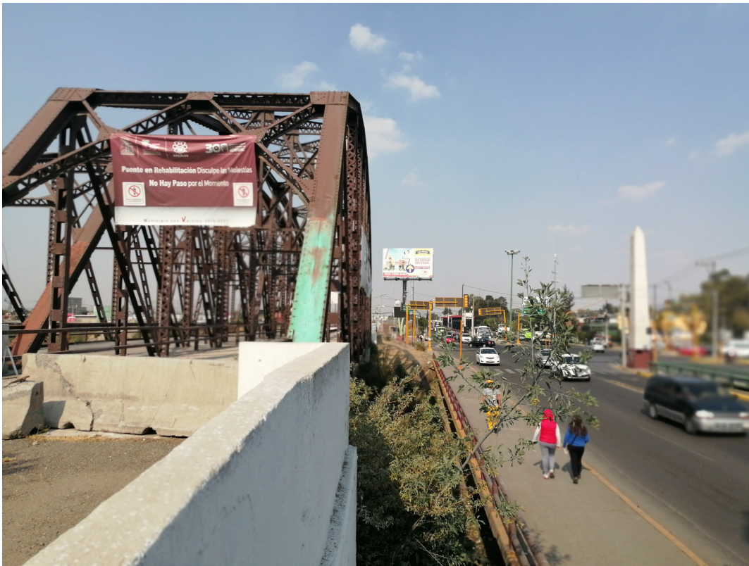
Imagen 12. Puente de fierro 2020 Fuente: Miquizcohuatl Mejía Márquez, Ecatepec de Morelos, diciembre 2020