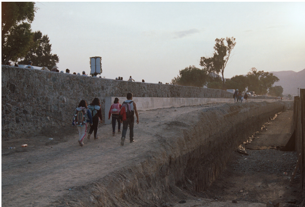
Imagen 3. Nueva fosa en el camino Fuente: Miquizcohuatl Mejía Márquez, Ecatepec de Morelos, diciembre 2017