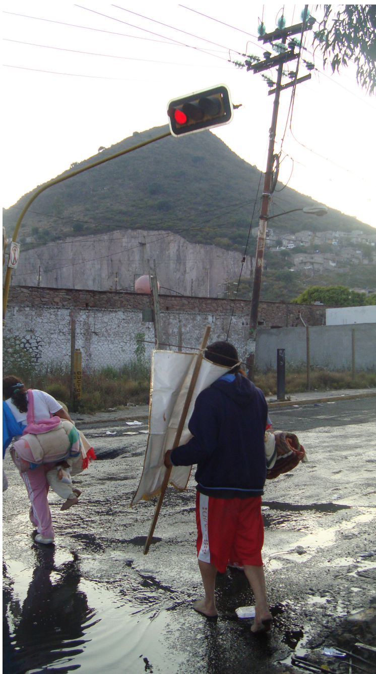
Imagen 15. Pies descalzos en las faldas del cerro Fuente: Ismael Mejía Hernández, Ecatepec de Morelos, diciembre 2011