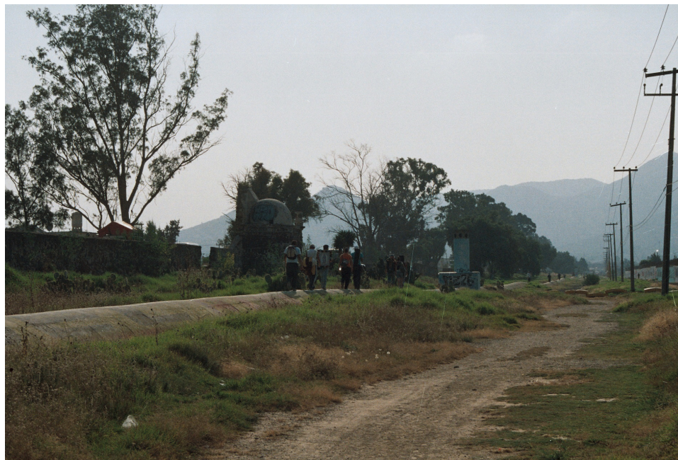
Imagen 1. Atravesando el albaradón en tiempo de secas Fuente: Ismael Mejía Hernández, Ecatepec de Morelos, diciembre 2009