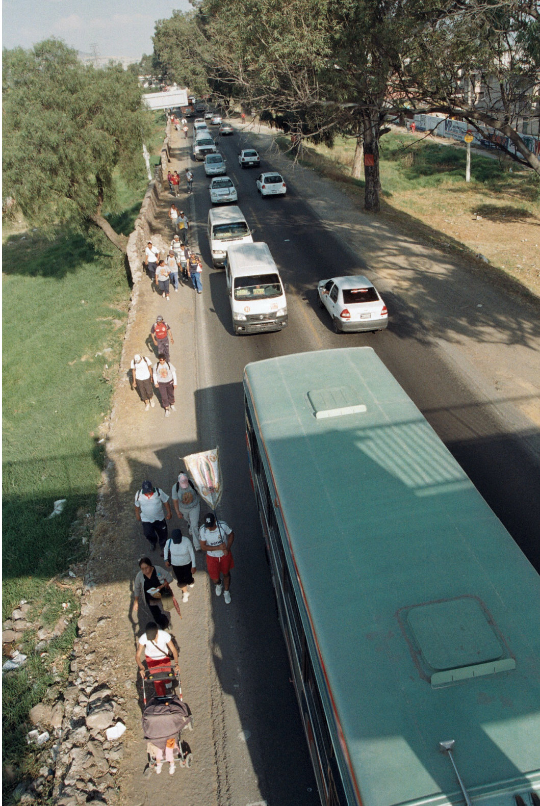
Imagen 5. Caminando a la orilla del albardón en ruinas Fuente: Ismael Mejía Hernández, Ecatepec de Morelos, diciembre 2009