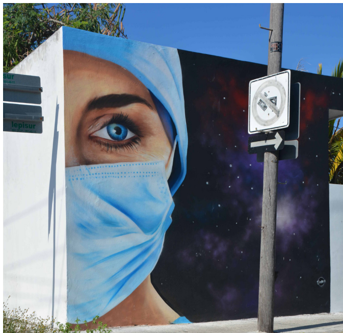
Atrás del hospital del ISSTE,(c. 7 con 34) en la c. 5c con c. 34 interior, se ve esta imagen de una enfermera. Dibujo de Arnold Cruz, Datoer.