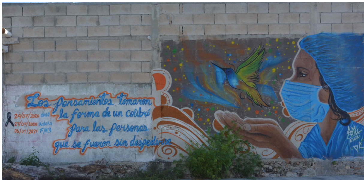
Con una bella frase se recuerda a tres fallecidos: ‘Chilo’ 24/072020; ‘Kalaka’ 27/07/2020 y ‘FM3’ 06/01/2020. Los pensamientos tomaron la forma de un colibrí para las personas que se fueron sin despedirse Pintado por ‘AMOU / EMR / PC en la calle 15 por 20 en Chuburná. Mérida.