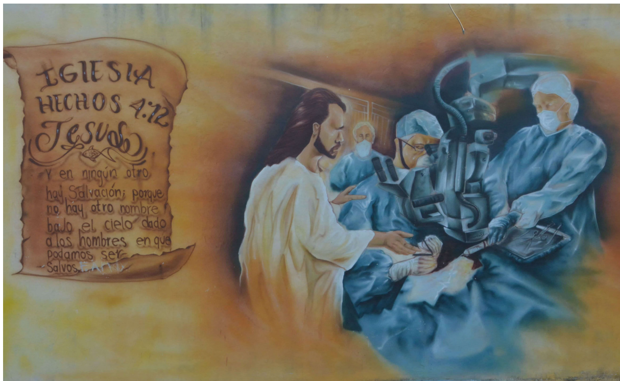
Con la ayuda de Dios, y los médicos, nos salvamos de la pandemia de COVID-19. Al lado de la Clínica del Seguro Social en C. 22 por 19 en Chuburná, Mérida. Artista desconocido.